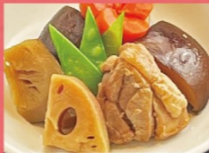
連島蓮根使用 筑前煮