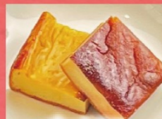
自家製 玉子カステラ