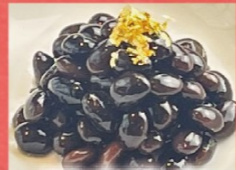
岡山県産 丹波黒豆煮