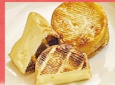
カマンベールチーズ 蕨焼き