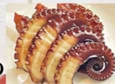
瀬戸内 活けダコ煮付け