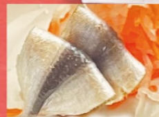
岡山名物 ママカリ酢漬け