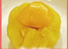
自家製 栗きんとん