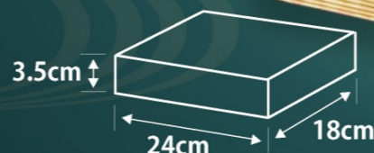
刺盛り用 & 寄せ鍋用内寸サイズ(外枠素材:紙)